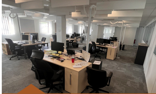
Centre de formation Mâcon | 1 600 m²

Réhabilitation d’un bâtiment abandonné. Les aménagements intérieurs ont été pensés à partir des besoins du futur occupant, un centre de formation destiné à recevoir 200 étudiants par an : aménagement de 10 salles de classe, mise aux normes ERP, sécurisation des accès et augmentation du stationnement.