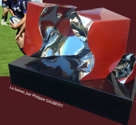
Le baiser par Philippe GAUBERT

Obazyne aime les artistes pour le regard différent qu'ils portent sur le monde. Leurs œuvres sont toujours sources de réflexion.