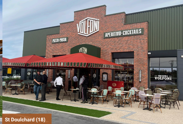
St Doulichard (18)