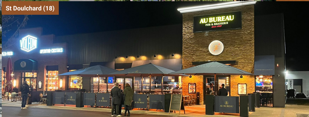
St Doulichard (18)