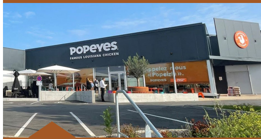
Pôle de restauration Brest | Finistère | 2 000 m²

Réhabilitation d’un bâtiment abandonné. Les aménagements intérieurs ont été pensés à partir des besoins du futur occupant, un centre de formation destiné à recevoir 200 étudiants par an : aménagement de 10 salles de classe, mise aux normes ERP, sécurisation des accès et augmentation du stationnement.